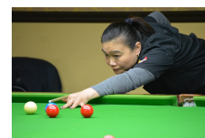
Campeonato Feminino e Juvenil