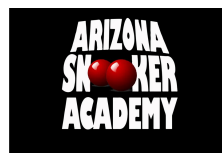
ROMIL AZEMET Academia de Snooker de Arizona